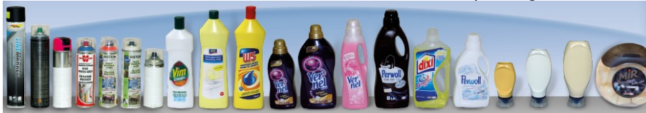
ETT Verpackungstechnik GmbH

Wir freuen uns schon jetzt auf Ihren Besuch!