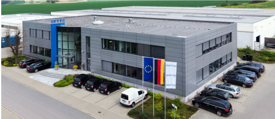
ETT Verpackungstechnik GmbH

Seite 2 zum Schreiben vom 5. Februar 2019